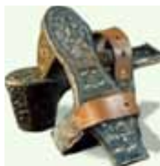
Bild: Holzsandalen mit Stegen bzw. Plateau-Sandalen, Ägypten, arabisch-islamisch

sohlen an eigenmächtigen Gängen außer Haus hindern wollte. Doch die Frauen waren bald erfinderisch und sie klebten große und leichte Korkblöcke unter starren Holzsohlen.