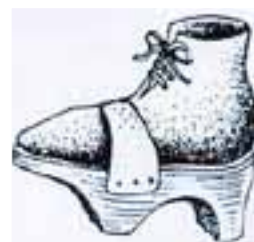
Trippen ließen bei ihren Trägern oder Trägerinnen jedoch nur einen trippelnden Gang zu.

Die Trippen wurden unter den eigentlichen Schuhen getragen und konnten durch Lederriemen am Fuß befestigt werden.