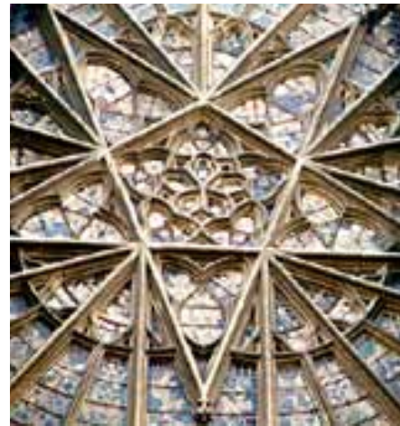
Bild: Nord-Fenster der Kathedrale Armeniens

Interessant ist, dass an vielen Kirchen das Pentagramm ebenfalls mit der Spitze nach unten dargestellt ist. - Gut oder böse? Absicht oder Zufall? Tatsache ist, dass wir bei genauer Betrachtung im Kern des "verkehrten" Symbols das "aufrechte" finden, wie wir zum Beispiel des Kathedralen-Fensters Armeniens entdecken können (aufrechtes Pentagramm im Kern des Bildes). Wieder sind wir bei den Gegensätzen - Yin und Yang - gelandet. Beide brauchen sich gegenseitig und sind untrennbar miteinander verbunden.