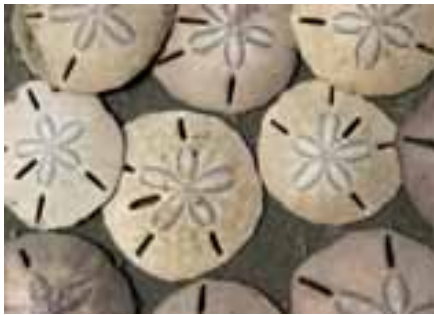
Bild: Der Sanddollar ist eine besondere Seeligelart, die an flachen Sandküsten lebt. Ihr Skelett zeigt eindeutig die Form eines Pentagramms.

Nehmen wir mal das Pentagramm näher unter die Lupe. Es ist eines der gebräuchlichsten Symbole der Esoterik und der Magie. Der fünfzackige Stern ergibt sich automatisch, wenn die Diagonalen eines regelmäßigen Fünfecks (Pentagon) nachgezogen werden (aus dem Griechischen: πεντάγραμμος pentágrammos ‚mit fünf Linien‘). Das Symbol ist wohl wie viele andere von der Natur abgeschaut und von verschiedensten alten Geschichten geprägt.