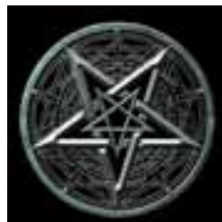
Bild: Logo der norwegischen Heavy Metal-Band "Dimmu Borgir". Der Bandname bedeutet auf Isländisch so viel wie „Dunkle Burgen“ oder „Dunkle Städte“.

In den 80ern sprang die aufkeimende Heavy Metal-Szene auf den Zug auf: Womit könnte man besser provozieren und zeigen, wie "evil" man ist, als mit dem Zeichen von Satan selbst?