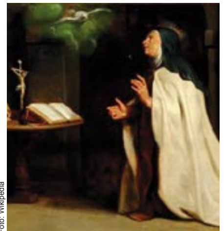
Gemälde von Peter Paul Rubens (1577 - 1640)

Der Dreieinigkeit werden Rot, Blau und Grün zugeordnet: Rot ist Gottvater, Blau Gottes Sohn und die Farbe des Heiligen Geistes ist Grün . Oft wird er bildlich als weiße Taube auf grünem Hintergrund dargestellt.