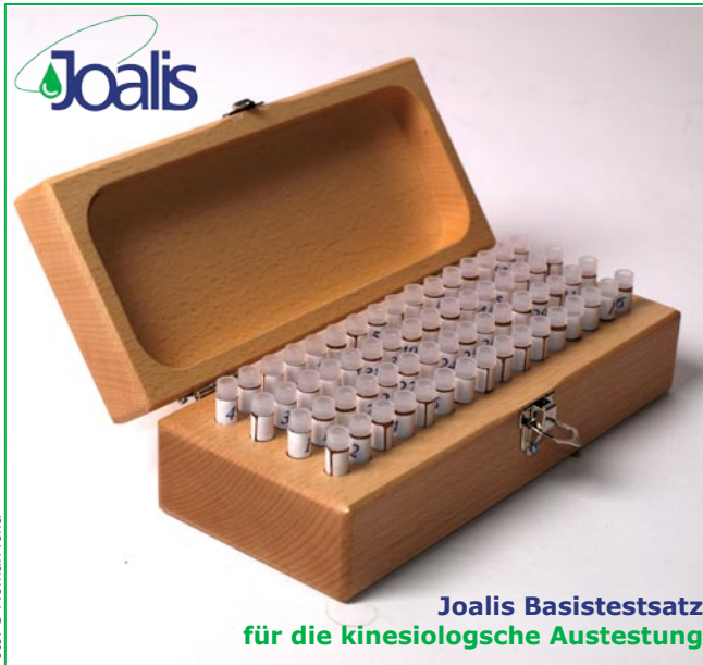
Joalis Basistestsatz für die kinesiologische Austestung